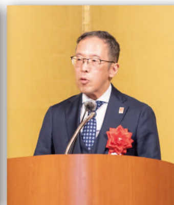
信谷近畿経済産業局長