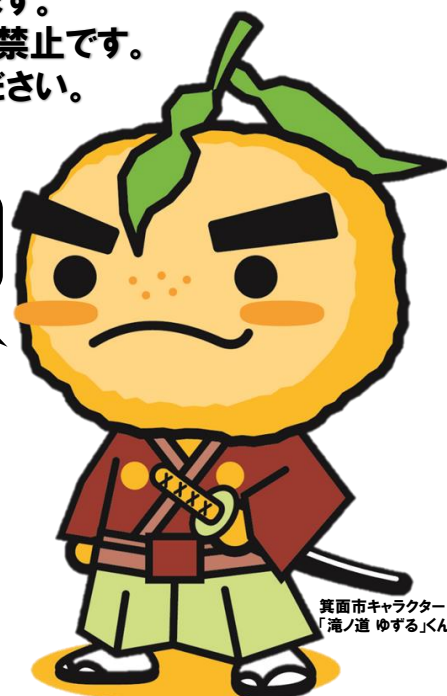
箕面市キャラクター 「滝ノ道 ゆする」くん