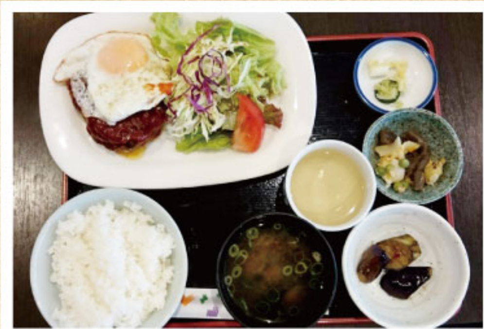
日替りランチ(コーヒー付) ¥900(税込)