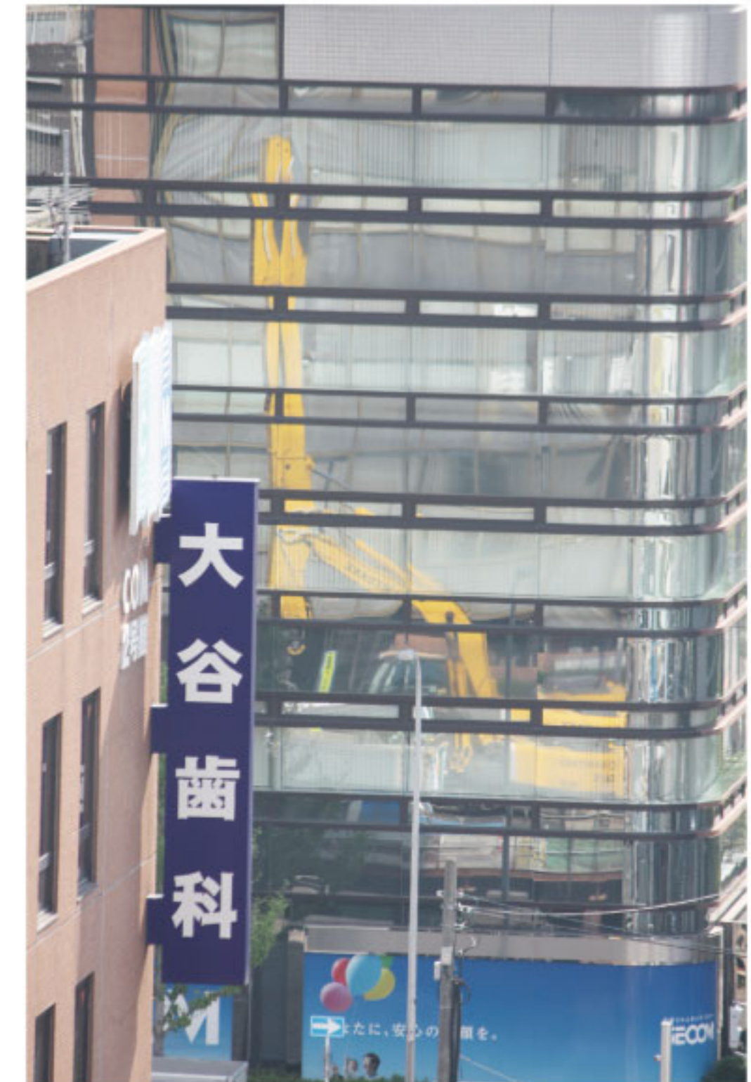
向いのビル壁に写る掘削用機械(クラムシェル)