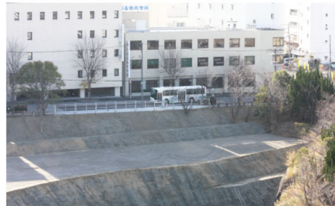
船場北公園土砂崩れによる通行止め解除後、 通行する団地バス(PDセンター屋上から)