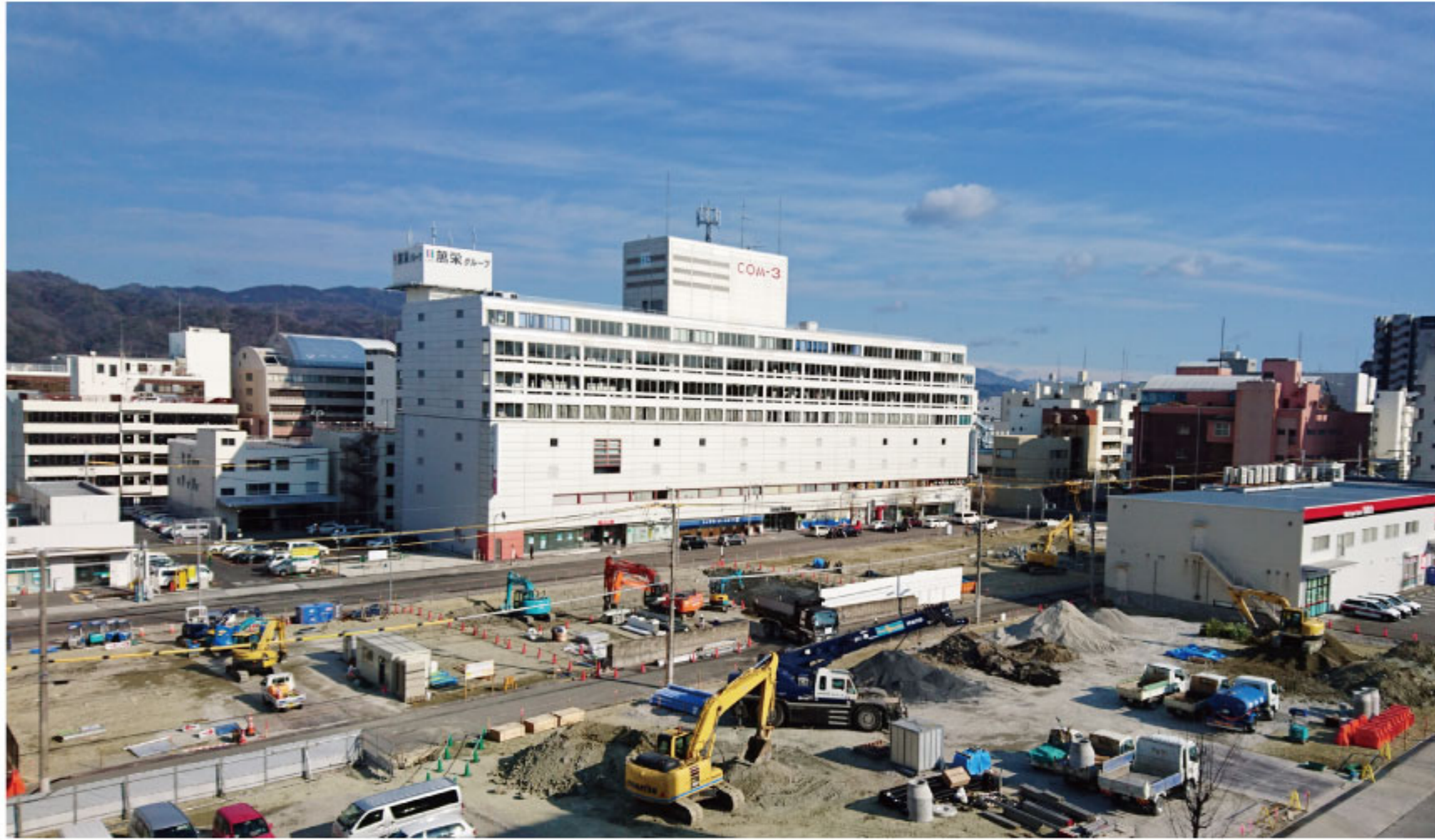
COM3号館の全体がとらえられた(南側から)