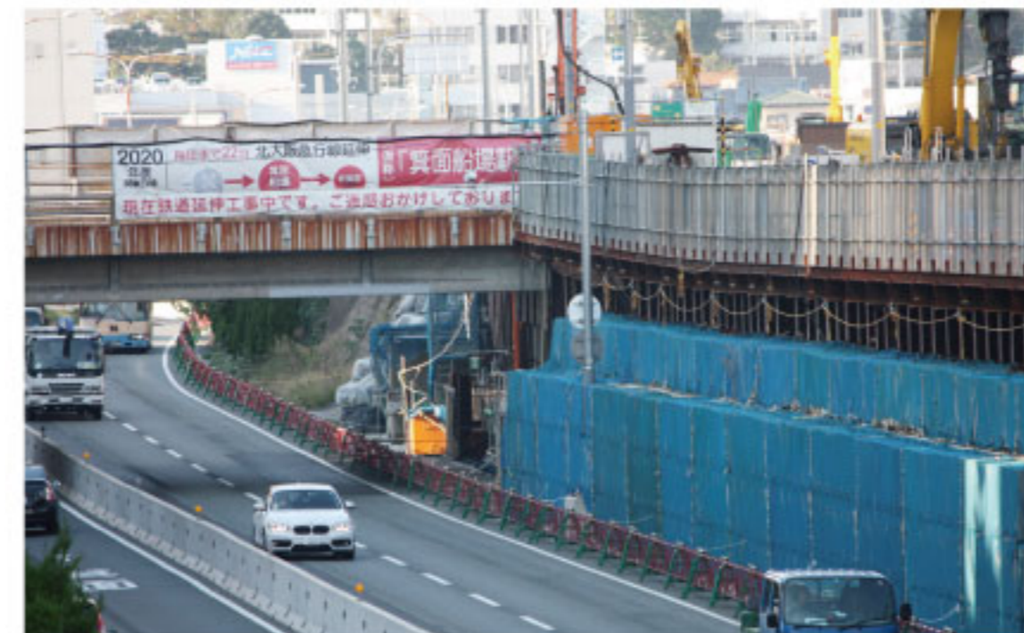
新船場北橋付近の工事を見る(南側から)