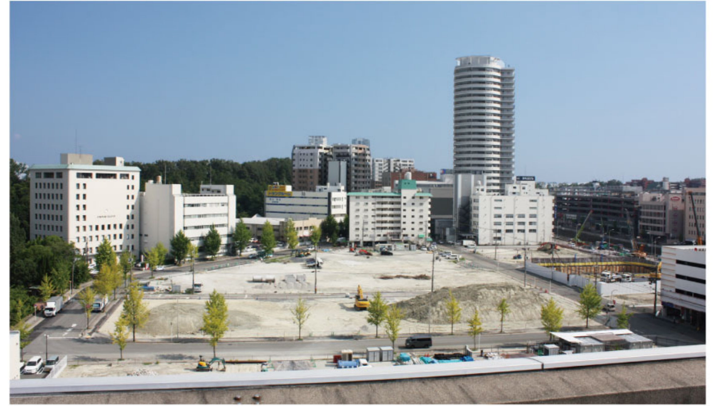
整地された箕面市船場東3丁目の一部(COM3号館屋上から)