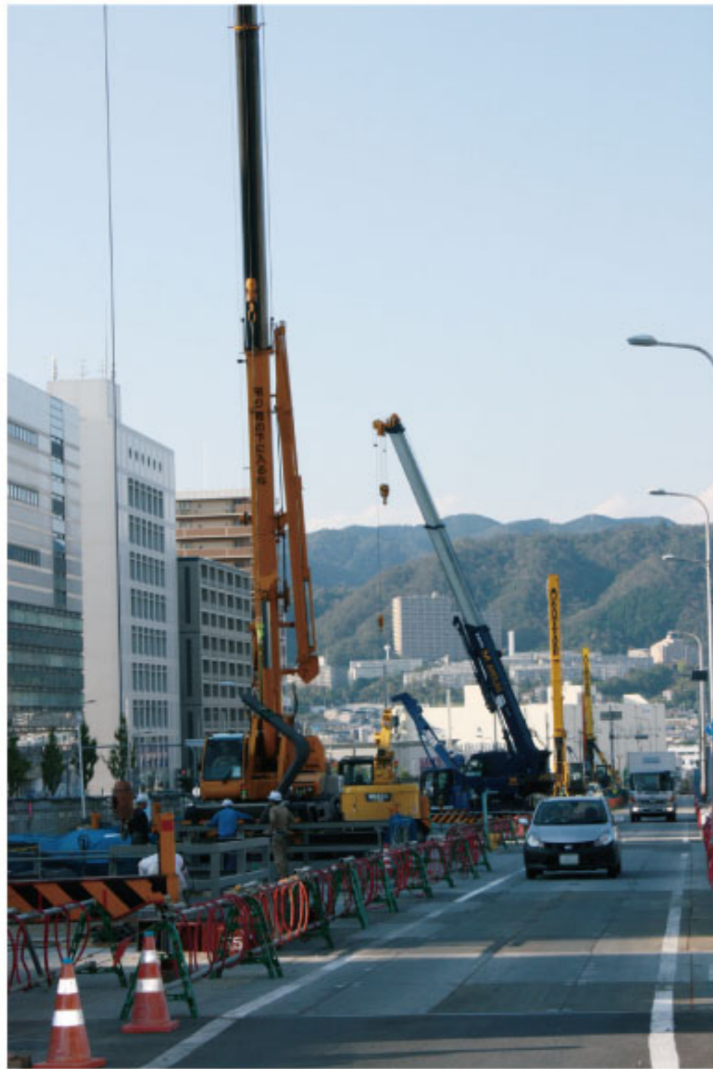
新御堂筋東側道に 林立するクレーン作業車