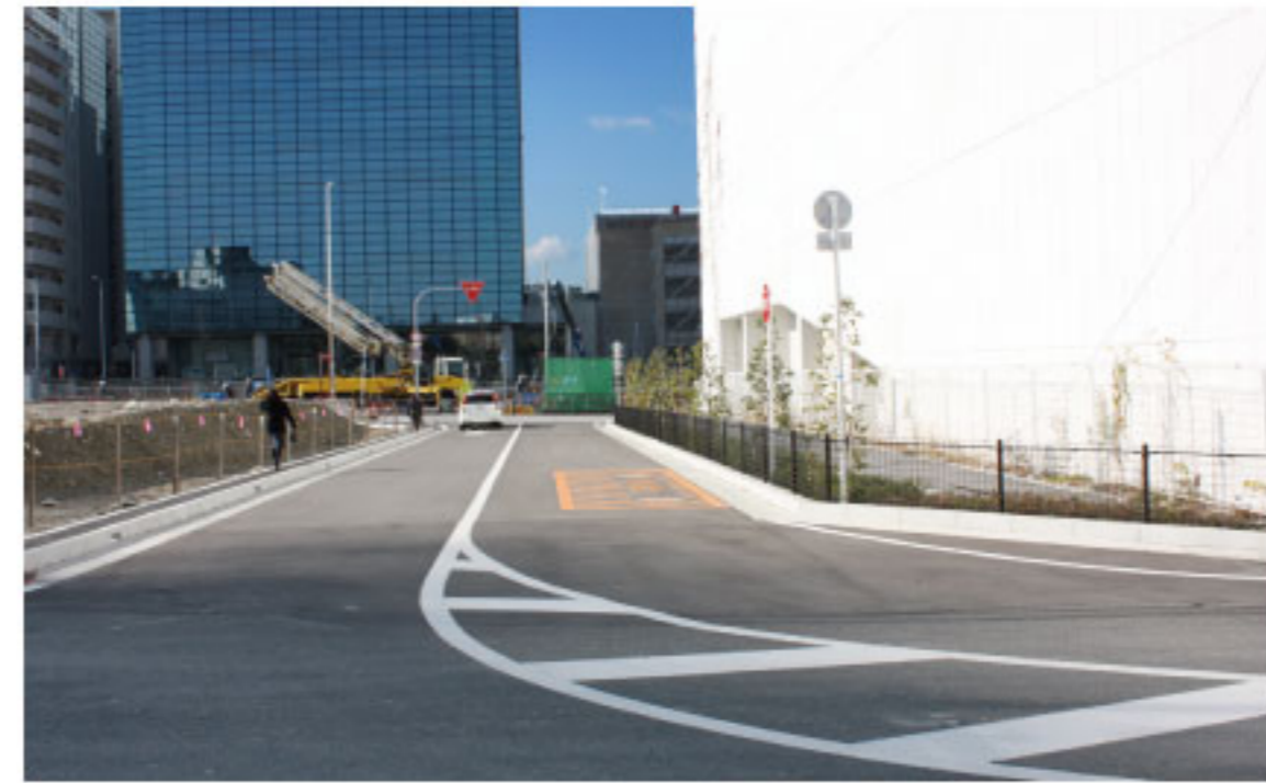
供用開始した新設道路