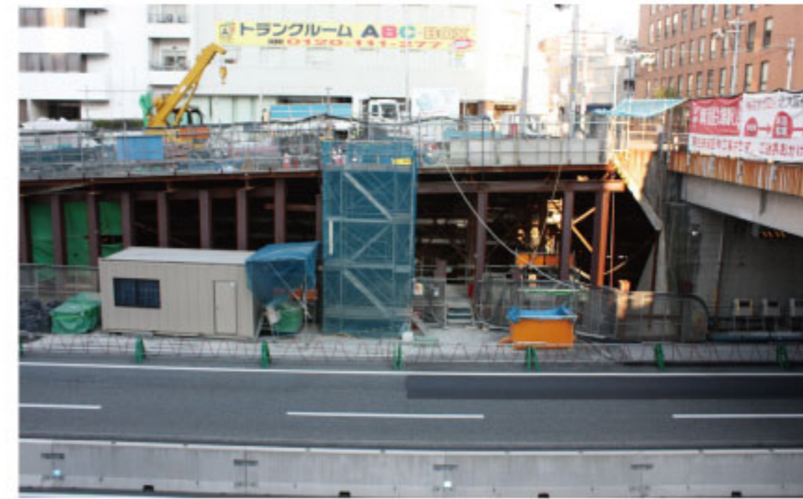
大阪府北部地震でも特に影響なし